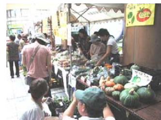
お客さんとのやりとりも楽しい1日でした！

とのつながりが発展し、地域密着型の有機野菜販売会に継続的な出展を行っておられます。