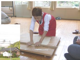
「いなか生活体験ツアー」にて