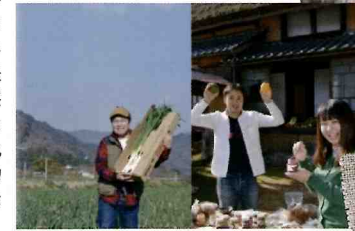
朝来市 地域おこし協力隊

年間50万人以上の観光客が訪れる竹田城をかかえる朝来市。少子高齢化で集落機能の低下が懸念される中、主に小学校区単位で形成された地域自治組織が、都市部からやってきた「地域おこし協力隊」の若者と一緒になって、コミュニティ・ビジネス等での地域課題の解決に取り組んでいます。視察する施設では、地産地消などで地域の農業を活性化するために、地域の農産物や加工品の発信を行っています。