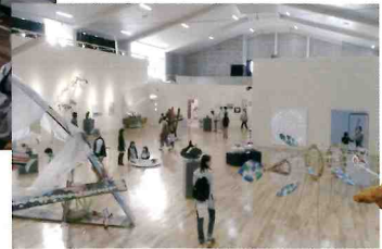
木彫 「現在」アート展の作品

養父市大屋町加保7 TEL 079-669-2449 多数の芸術家が活動する大屋町。廃校となった高校の校舎を活用し、自然とともに暮らす人々とアートが融合する拠点として、おおやアート村BIG LABOがオープン。体育館はミュージアムに、教室は貸アトリエ、まんが図書館、創作室に。地域資源を活かしたワークショップ、手作り市などを開催しています。