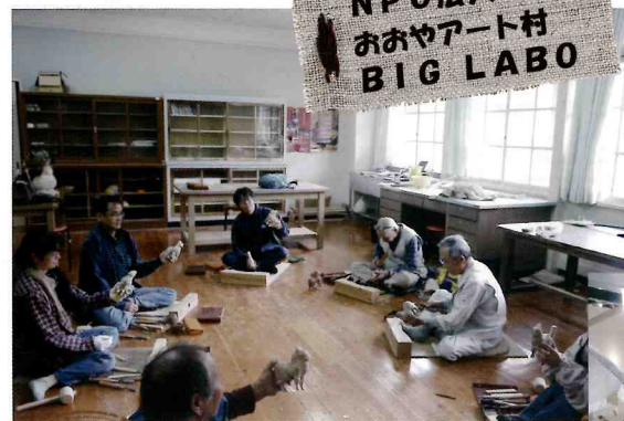
NPO法人 おおやアート村 BIG LABO