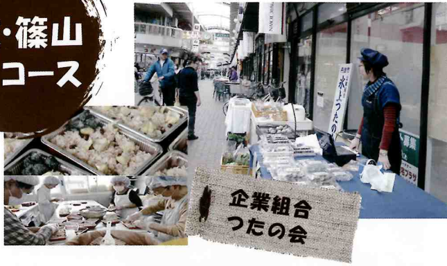
企業組合 つたの会